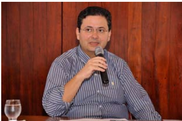
Palestra proferida no Museu do Estado de Pernambuco, em 20 de abril de 2010.