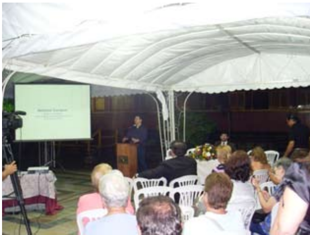
Palestra proferida na sede da União Brasileira dos Escritores – UBE/PE, no Recife, em 23 de abril de 2010, em comemoração do Dia Mundial do Livro.