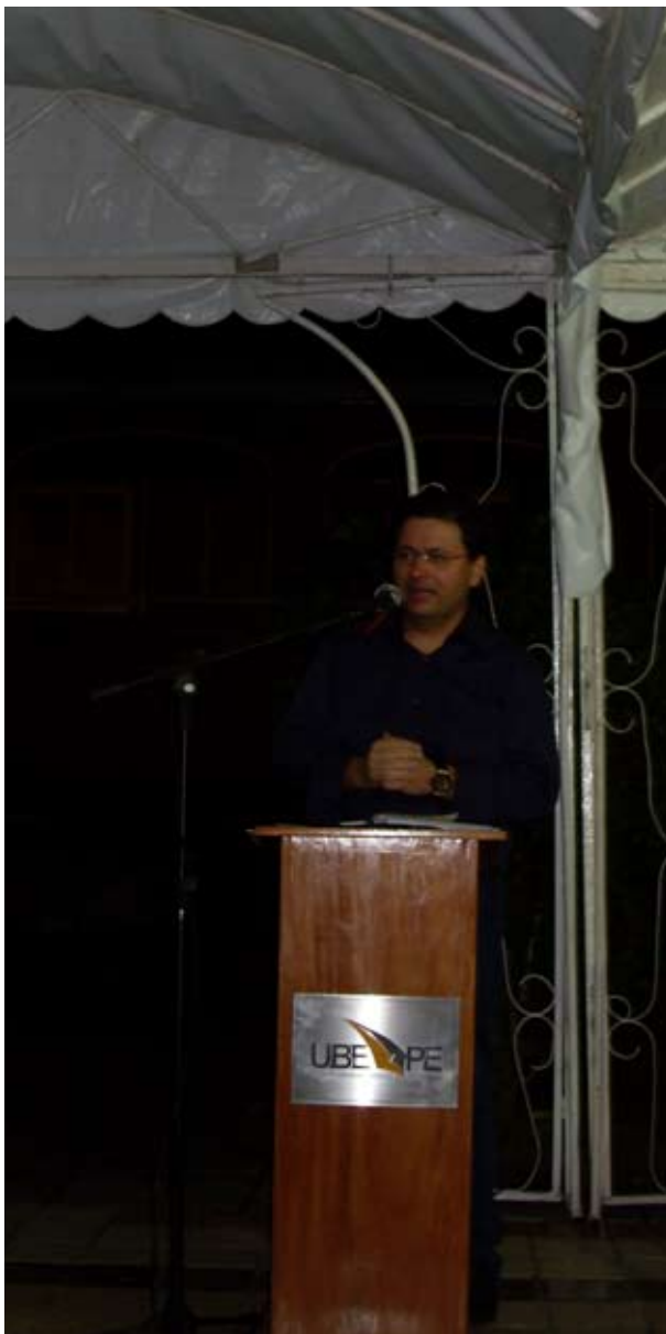
Palestra proferida na sede da União Brasileira dos Escritores – UBE/PE, no Recife, em 23 de abril de 2010, em comemoração do Dia Mundial do Livro.